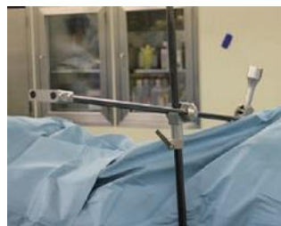
Zimmer Biomet 社マジックタワー