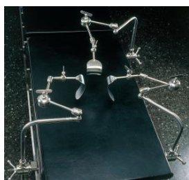
ユフ精器のオクトパス